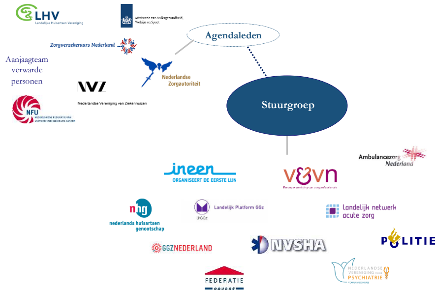
Figuur 2.2. Overzicht partijen in stuurgroep en agendaleden