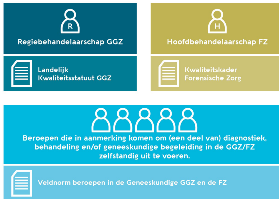
Figuur: Verhouding Veldnorm tot Landelijk Kwaliteitsstatuut GGZ en Kwaliteitskader Forensische Zorg

Deze veldnorm is het startpunt en het sluitstuk van veel andere afspraken over kwaliteit. Deze zijn vastgelegd in richtlijnen en veldnormen die beschreven wat kwaliteit van zorg is. Op basis van deze bestaande normen heeft Akwa GGZ een overzicht gemaakt van de beroepen die een rol hebben in ggz en fz. Op basis van objectieve kwaliteitscriteria is vervolgens bepaald welke van die beroepen in aanmerking komen om (een deel van) diagnostiek, behandeling en/of geneeskundige begeleiding zelfstandig uit te voeren. Daarmee is deze veldnorm ook weer input voor andere veldnormen en richtlijnen die zorg beschrijven. Met deze veldnorm borgen wij dat iedereen dezelfde basisnormen hanteert bij het inzetten van beroepen in de ggz en fz.